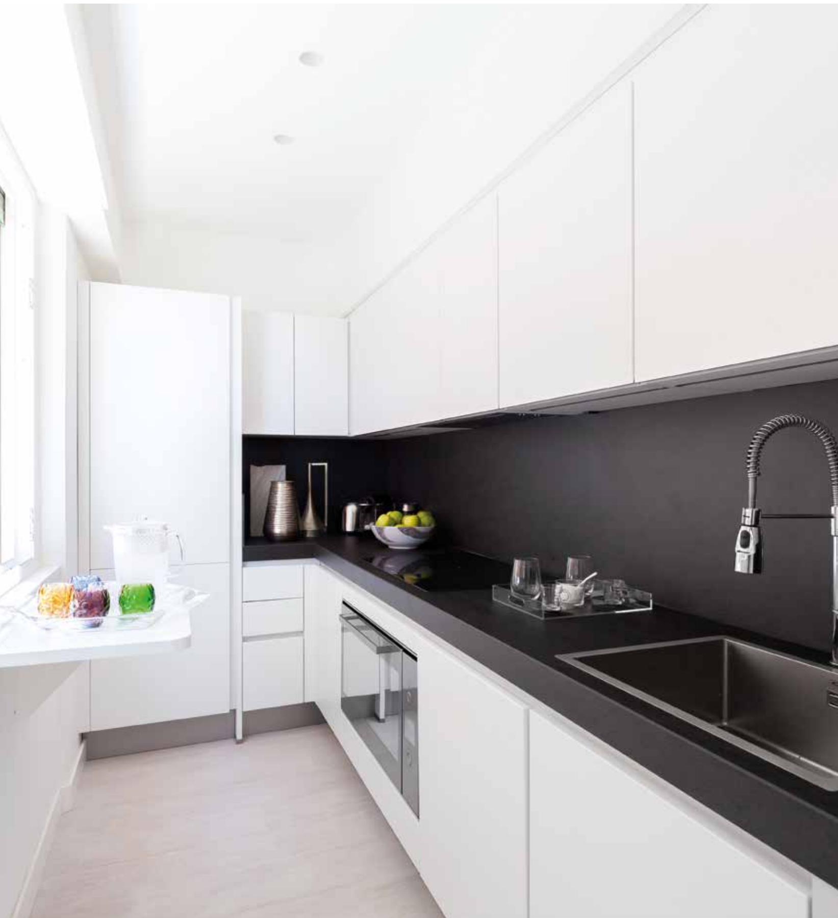
SOPRA, CUCINA DISTRIBUITA DA ELDIS DI ROMA (WWW.ELDISNET.IT) A DESTRA, LA VEDUTA DELLA MARINA DI PORTO ERCOLE ABOVE, KITCHEN LAYOUT BY ROME-BASED FIRM ELDIS (WWW.ELDISNET.IT). RIGHT, VIEW OF THE PORTO ERCOLE MARINA