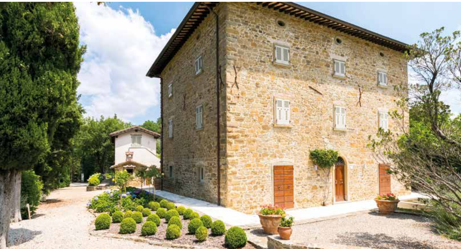
IN QUESTA PAGINA, ALCUNE AIUOLE CREATE SEGUENDO LINEE GEOMETRICHE. A FIANCO, I VIGNETTI NELLA VALLE VERSO LA QUALE SI PROIETTA IL GIARDINO. ON THIS PAGE, A FEW FLOWERBEDS WITH A GEOMETRIC DESIGN ALONGSIDE VINEYARDS IN THE VALLEY FACING THE GARDEN.

cliente a 360°. Forti della loro lunga esperienza sul campo questi progettisti sono riusciti a realizzare, in accordo con i committenti, uno scenario nuovo, pur nel rispetto dello spirito del giardino e del luogo. La struttura del verde progettato, di circa 2000 mq, è stata suddivisa in due grandi aree: la prima, più funzionale, dedicata ai parcheggi auto e all'ingresso carrabile; la seconda, più decorativa, riservata alla convivialità e al relax. Man mano che ci si allontana dalla casa, il verde digrada verso le zone più esterne della proprietà, volutamente mantenute a vigneto e uliveto. "L'intenzione è stata fin da subito quella di trasformare il terreno, in forte stato di abbandono, in uno spazio disegnato in cui creare originali giochi geometrici, conservando sempre un forte legame con il passato", racconta il progettista a Ville&Casali , che aggiunge: "era essenziale, quindi, inserire sia elementi classici della tradizione toscana che linee più moderne e audaci". Il risultato è un'armonia impeccabile: aiuole dai contorni marcati si alternano a campiture più naturali, viottoli in pietra di recupero dall'andamento sinuoso conducono