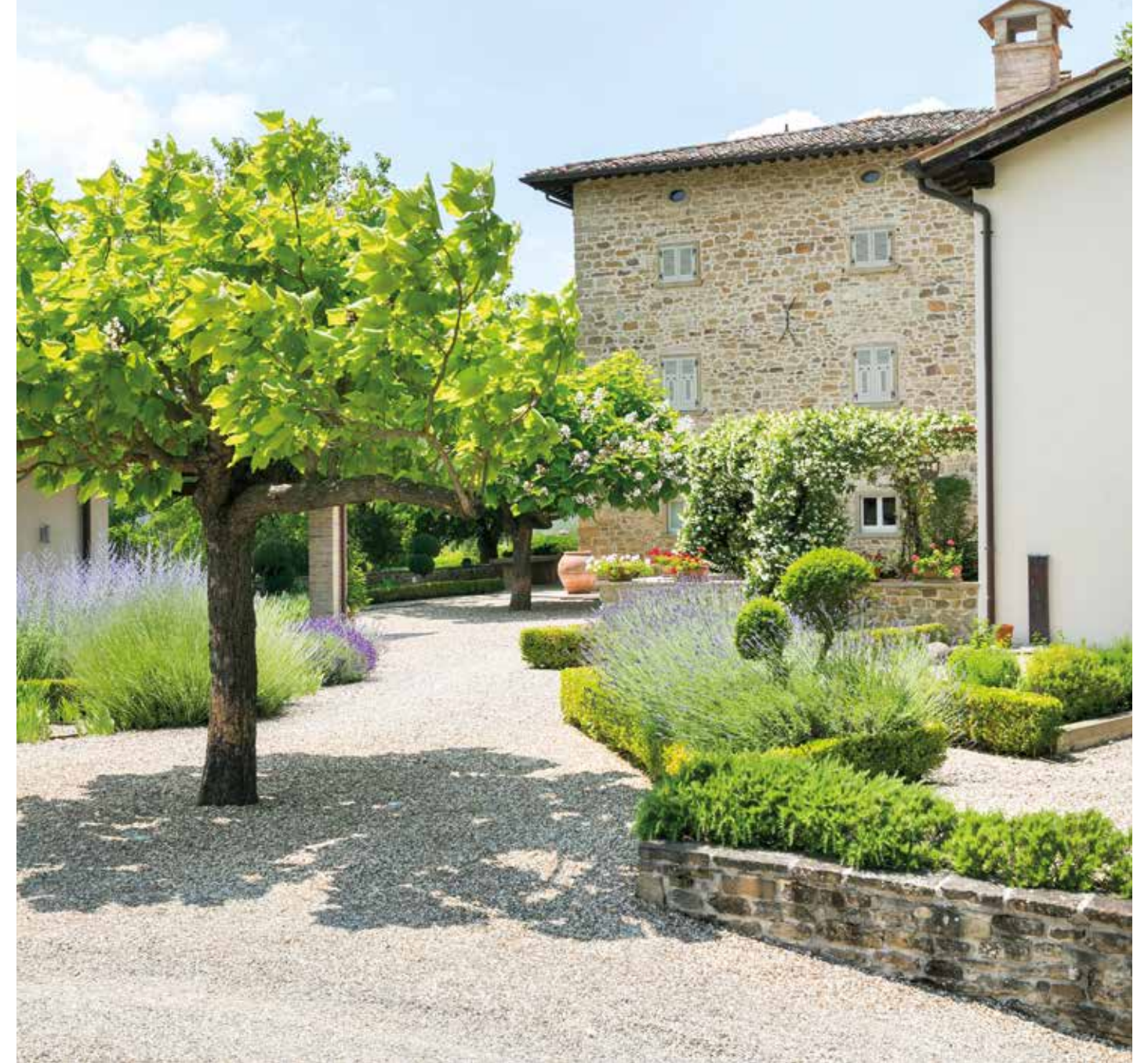
IN APERTURA, UNA VEDUTA DEL GIARDINO A PRATO. IN QUESTE PAGINE, LO SPAZIO VERDE È CARATTERIZZATO DA UNA RICCA BIODIVERSITÀ DI SPECIE. POCHI GLI ACCENTI DI COLORE, COME LA LAVANDA. OPENING PAGE, A VIEW OF THE LAWN. IN THESE PAGES, THE GREEN SPACE BOASTS RICH BIODIVERSITY. THERE ARE JUST A FEW TOUCHES OF COLOUR, SUCH AS LAVENDAR.

P er arrivarci è necessario attraversare una delle più incantevoli vedute della Valtiberina toscana: il territorio compreso nel parco dei Monti Rognosi e della Valle del Sovara, ricco di memorie storiche, segnato da corsi d'acqua e abitato da una particolare flora e fauna autoctona. Uno scenario dominato da una distesa di rocce che affiorano in mezzo alle colline e che ha affascinato sin da subito una giovane famiglia inglese con bambini, pronta ad affidarsi allo studio di architettura toscano Arkproject Camaiti