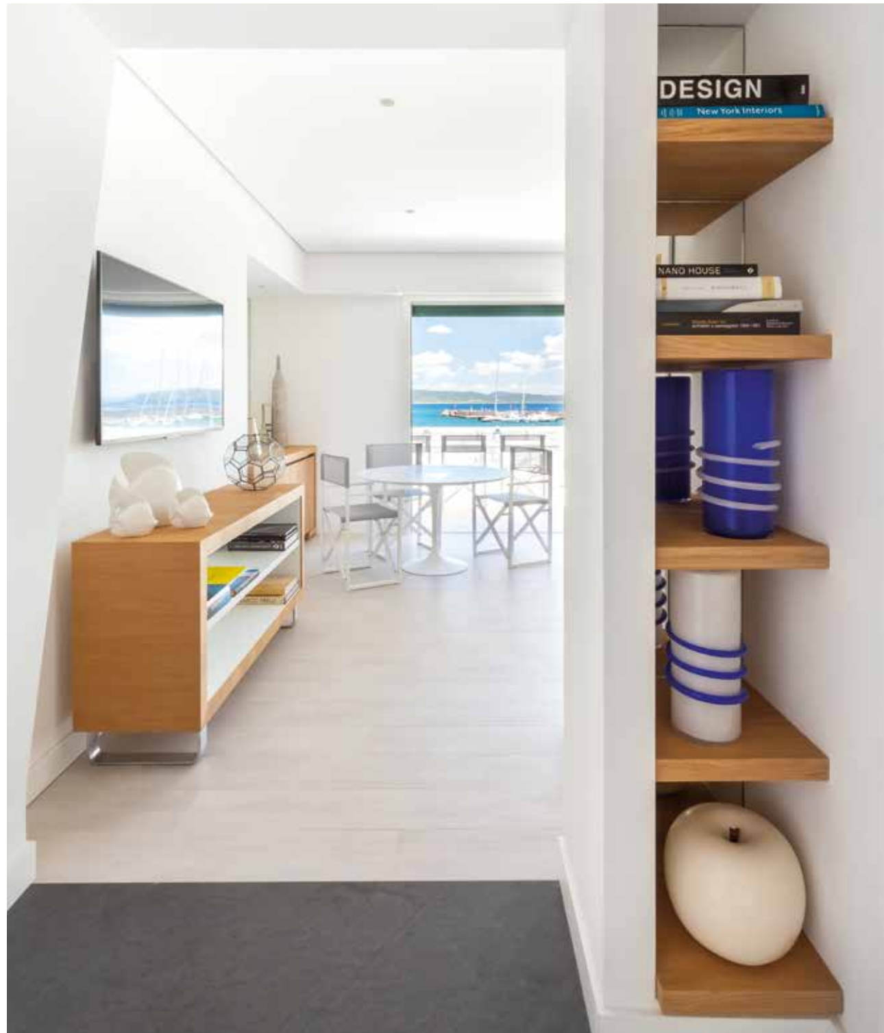
IN APERTURA, VISTA DEL PORTO DALLA TERRAZZA DOVE SPICCA UN TAVOLO ESTERNO DI GANDIA BLASCO, IN QUESTE PAGINE, L'INGRESSO TRAPEZOIDALE DELLA ZONA LIVING E A DESTRA, ALL'ANGOLO UN MOBILE DISPENSA DISEGNATO DALL'ARCHITETTO ROMANO. GLI INFISSI IN PVC SONO FIRMATI SCHÜCO. OPENING PAGE, VIEW OF THE HARBOUR FROM THE TERRACE, WHICH BOASTS AN OUTDOOR TABLE BY GANDIA BLASCO. IN THESE PAGES, THE TRAPEZOIDAL ENTRANCE TO THE LIVING AREA AND RIGHT, IN THE CORNER, A PANTRY CABINET DESIGNED BY THE ROMAN ARCHITECT. THE PVC WINDOW FIXTURES ARE BY SCHÜCO.

e scrutare il passaggio sul porto. "Per proiettare la casa sul mare", spiega l'architetto Busiri Vici a Ville&Casali , "ho dato continuità all'interno con l'esterno utilizzando un pavimento in gres por-