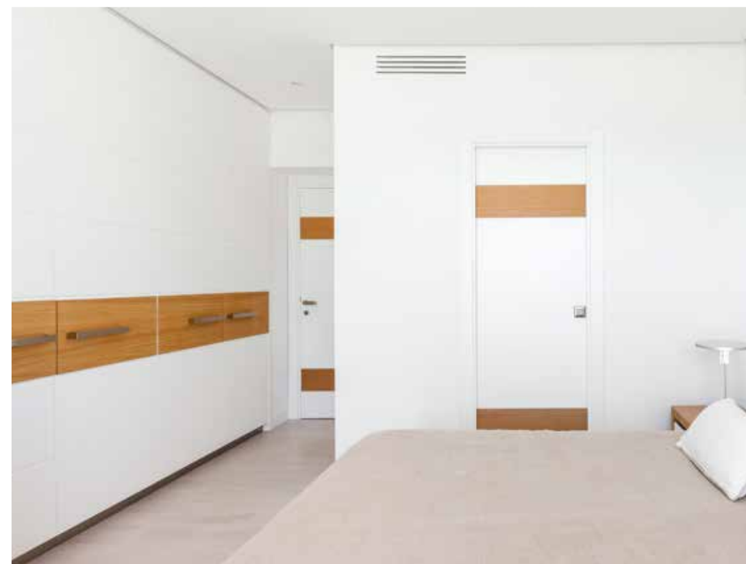
A SINISTRA, LETTO E COMODINI SONO DISEGNATI DALL'ARCHITETTO BUSIRI VICI E REALIZZATI DA ARTIGIANO DEL MOBILE DI ROMA. LAMPADA BEAU JOUR DI FLOS. QUADRO DI OLIVIERO RAINALDI. SOPRA, IL BAGNO PADRONALE. LEFT A BED AND BEDSIDE TABLES DESIGNED BY ARCHITECT BUSIRI VICI AND MADE BY ARTIGIANO DEL MOBILE IN ROME. BEAU JOUR LAMP BY FLOS. PAINTING BY OLIVIERO RAINALDI. ABOVE, THE MASTER BATHROOM.