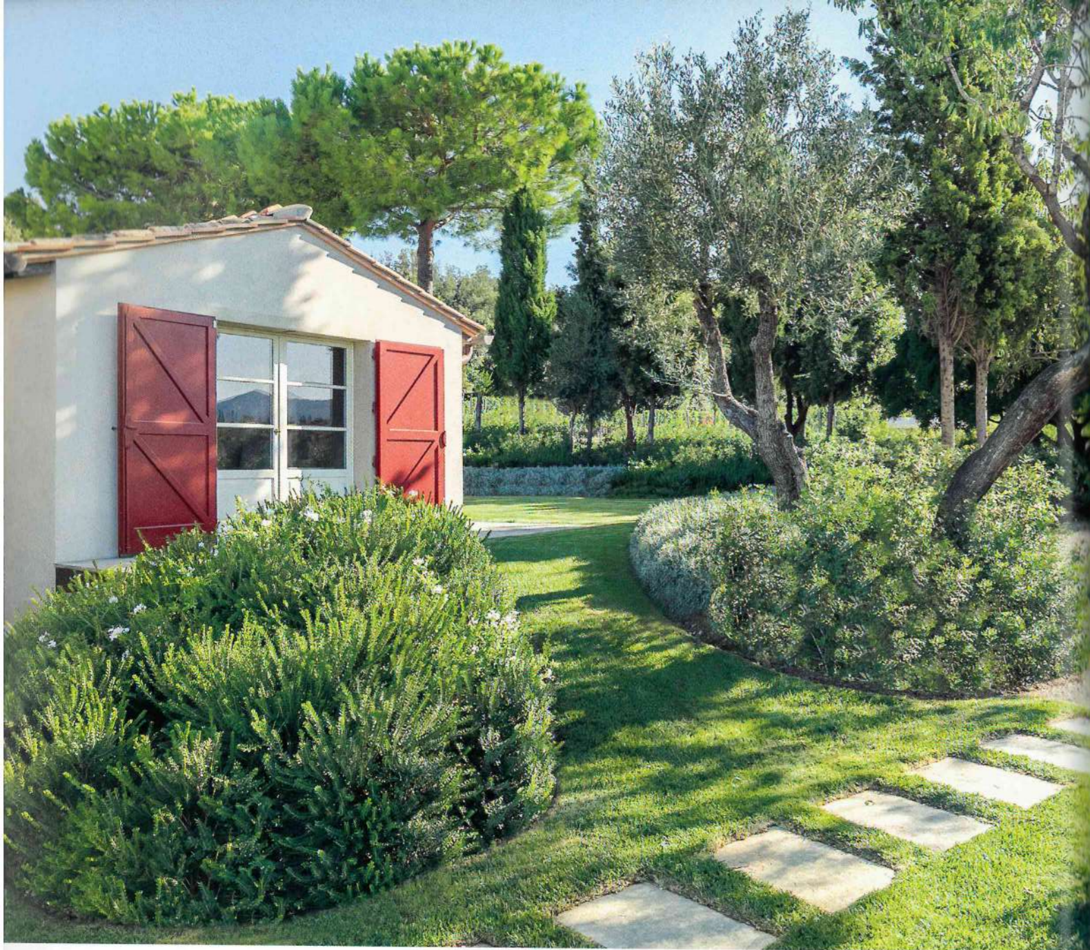
IN QUESTA PAGINA, UN'AIUOLA CON IL PLUMBAGO BIANCO E IL MIRTO E UNA BORDURA CON UN ESEMPLARE DI MANDORLO. A FIANCO, UNA PORZIONE DI GIARDINO TRATTATO A PRATO. ON THIS PAGE, FLOWERBED WITH WHITE PLUMBAGO AND MYRTLE AND A BORDER WITH ALMOND TREE. AT THE SIDE, A SECTION OF THE GARDEN LAID TO LAWN.

bella proprietà circondata da un giardino di circa 2000 mq. "Il terreno sorge in una posizione strategica.